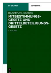
Raiser/Veil/Jacobs Mitbestimmungsgesetz u. Drittelbeteiligungsgesetz