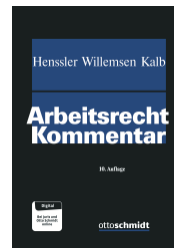
Hensler/Willemsen/Kalb Arbeitsrecht Kommentar