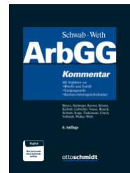
Schwab/Weth (Hrsg.) ArbGG