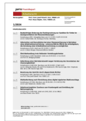
juris PraxisReport Arbeitsrecht