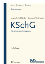
Löwisch/Schlünder u.a. KSchG