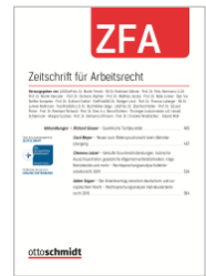
Zeitschrift für Arbeitsrecht (ZFA)