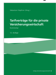
Hopfner (Hrsg.) Tarifverträge für die private Versicherungswirtschaft