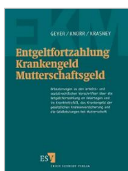
Knorr/Krasney Entgeltfortzahlung, Krankengeld, Mutterschaftsgeld