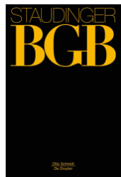
STAUDINGER Online Arbeitsrecht