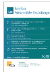
Sammlung Arbeitsrechtlicher Entscheidungen (SAE)