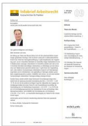
Infobrief Arbeitsrecht (IB Arbeitsrecht)