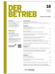
DER BETRIEB (DB) Rubrik Arbeitsrecht