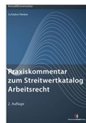
Schäder/Weber Praxiskommentar zum Streitwertkatalog Arbeitsrecht