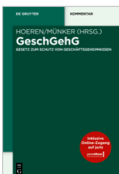
Hoeren/Münker (Hrsg.) GeschGehG