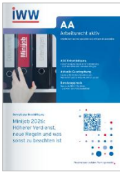
Arbeitsrecht aktiv (AA)