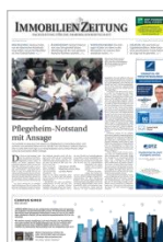
Immobilien Zeitung (IZ)