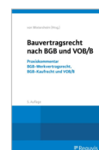
von Wietersheim (Hrsg.) Bauvertragsrecht nach BGB und VOB/B