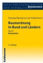
Cholewa/Dyong/von der Heide/Arenz Raumordnung in Bund und Ländern