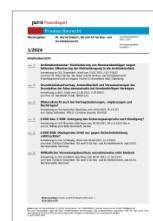
Juris PraxisReport Privates Baurecht