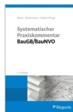
Rixner/Biedermann/Charlier (Hrsg.) Systematischer Praxiskommentar BauGB/BauNVO