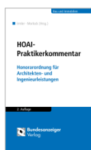
Irmler/Morlock (Hrsg.) HOAI Praktikerkommentar