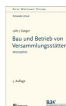
Löhr/Gröger Bau und Betrieb von Versammlungsstätten