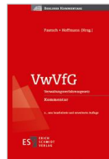
Pautsch/Hoffmann (Hrsg.) VwVfG