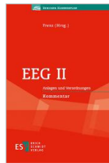
Frenz (Hrsg.) EEG II