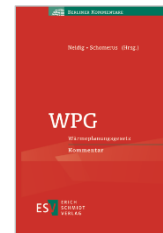
Neidig/Schomerus (Hrsg.) WPG