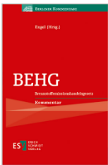
Engel (Hrsg.) BEHG