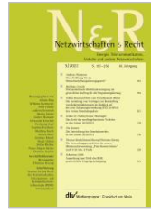
Netzwirtschaften und Recht (N&R)