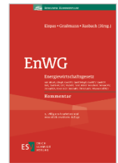
Elspar/Graßmann/ Rasbach (Hrsg.) EnWG