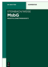
Rohrer/Karsten/Leonhard t (Hrsg.) MsbG