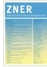
Z. für Neues Energierecht (ZNER)