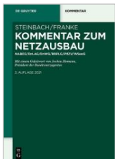
Steinbach/Franke (Hrsg.) Kommentar zum Netzausbau