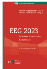
Frenz/Müggenborg u.a. EEG