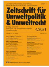
Z. für Umwelt-politik und Umweltrecht (ZfU)