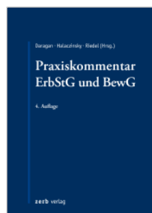
Daragan/Halaczinsky/ Riedel (Hrsg.) Praxiskommentar ErbStG und BewG