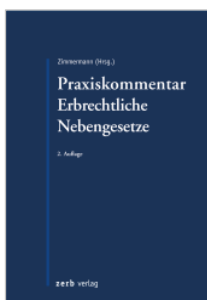
Zimmermann (Hrsg.) Praxiskommentar Erbrechtliche Nebengesetze