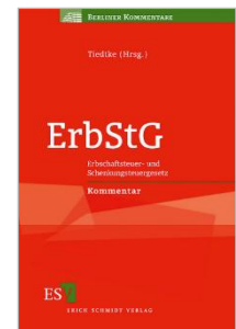
Tiedtke (Hrsg.) ErbStG