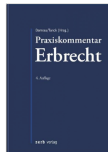
Damrau/Tanck (Hrsg.) Praxiskommentar Erbrecht