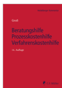
Groß Beratungshilfe, Prozesskostenhilfe, Verfahrenskostenhilfe