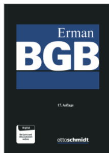
Westermann/Grunewald/ Maier-Reimer (Hrsg.) Erman BGB