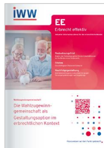
Erbrecht effektiv (EE)