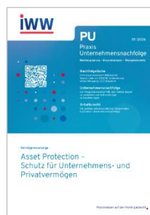
Praxis der Unternehmensnachfolge (PU)