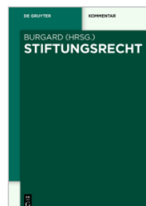
Burgard (Hrsg.) Stiftungsrecht