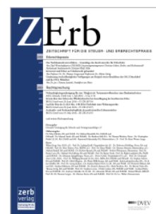
Zeitschrift für die Steuer- und Erbrechtspraxis (ZErb)