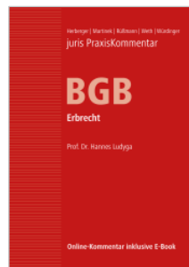
Hau/Herberger/Martinek/Rüßmann/Weth/Würdinger (Hrsg.) juris PraxisKommentar BGB, Band 5 Erbrecht