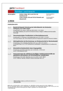
juris PraxisReport Familien- und Erbrecht