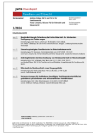
juris PraxisReport Familien- und Erbrecht