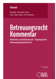
Bienwald (Begr.) Betreuungsrecht