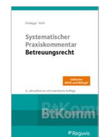
Dodegge/Roth Systematischer Praxiskommentar Betreuungsrecht