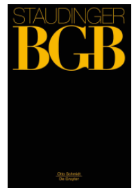
STAUDINGER Online Buch 4 Familienrecht EGBGB/IPR