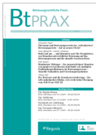
Betreuungsrechtliche Praxis (BtPrax)