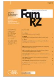
Zeitschrift für das gesamte Familienrecht (FamRZ)