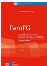
Bahrenfuss (Hrsg.) FamFG