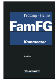
Prütting/Helms (Hrsg.) FamFG