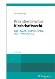
Heilmann (Hrsg.) Praxiskommentar Kindschaftsrecht