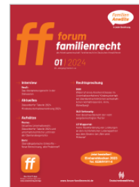
Forum Familienrecht (FF)