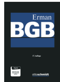
Westermann/Grunewald/ Maier-Reimer (Hrsg.) Erman BGB