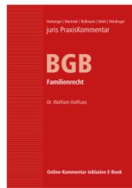
Juris-PK BGB Band 4 Familienrecht