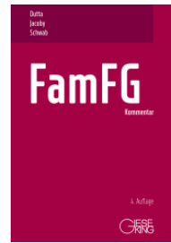
Dutta/Jacoby/Schwab (Hrsg.) FamFG