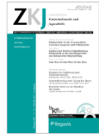
Zeitschrift für Kindschaftsrecht und Jugendhilfe (ZKJ)