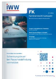
Familienrecht kompakt (FK)