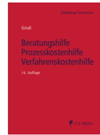
Groß Beratungshilfe Prozesskostenhilfe Verfahrenskostenhilfe