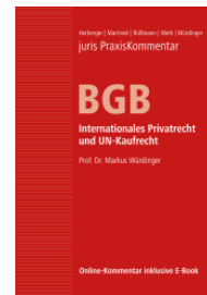
Juris-PK BGB Band 6 IPR und UN-Kaufrecht