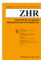
Zeitschrift für das gesamte Handelsrecht und Wirtschaftsrecht (ZHR)