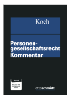
Koch (Hrsg.) Personengesellschaftsrecht Kommentar