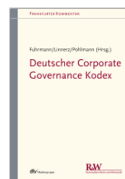
Fuhrmann/Linnerz/Pohlmann Deutscher Corporate Governance Kodex