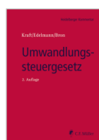
Kraft/Edelmann/Bron (Hrsg.) Umwandlungssteuergesetz