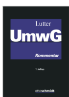
Lutter/Bayer/Vetter UmwG L