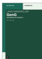
Lang/Weidmüller GenG Genossenschaftsgesetz