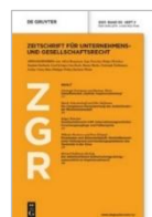
Zeitschrift für Unternehmens- und Gesellschaftsrecht (ZGR)