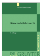
von Waldstein/Holland Binnenschiffahrtsrecht