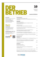
DER BETRIEB (DB)