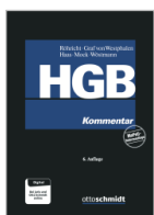
Röhrich/Graf von Westphalen/Haas (Hrsg.) HGB