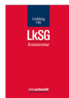
Gehling/Ott (Hrsg.) LkSG