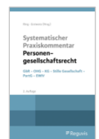
Ring/Grziwotz (Hrsg.) System. Praxiskommentar Personengesellschaftsrecht