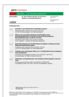
juris PraxisReport Handels- und Gesellschaftsrecht