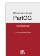
Römermann (Hrsg.) PartGG