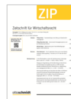
Zeitschrift für Wirtschaftsrecht (ZIP)