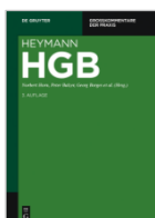
Heymann (Begr.)/ Horn u. a. (Hrsg.) HGB, Bd. 1-4