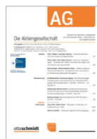
Die Aktiengesellschaft (AG)