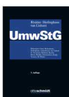
Rödder/Herlinghaus/van Lishaut UmwStG