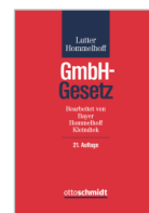
Lutter/Hommelhoff/ Bayer/Kleindiek GmbH-Gesetz