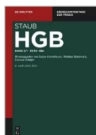
STAUD HGB Gesamtausgabe