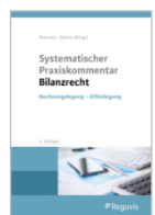
Petersen/Zwirner (Hrsg.) System. Praxiskommentar Bilanzrecht