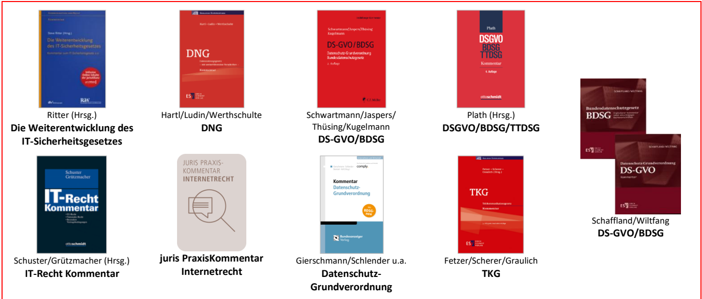
Ritter (Hrsg.) Die Weiterentwicklung des IT-Sicherheitsgesetzes