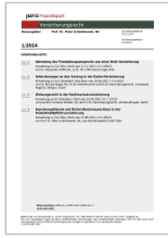
juris PraxisReport Versicherungsrecht