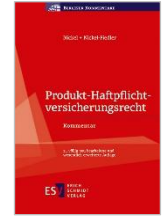
Nickel/Nickel-Fiedler Produkt-Haftpflicht- versicherungsrecht