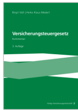
Voß/Medert (Hrsg.) Versicherungsteuergesetz