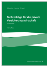
Hopfner (Hrsg.) Tarifverträge für die private Versicherungswirtschaft