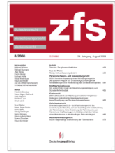
Zeitschrift für Schadensrecht(zfs)