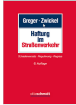
Greger/Zwickel Haftung im Straßenverkehr