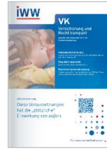
Versicherung und Recht kompakt (VK)