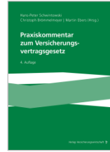
Schwintowski/Brömmelmeyer Praxiskommentar zum Versicherungsvertragsgesetz