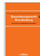
Jäde/Dirnberger Bauordnungsrecht Brandenburg