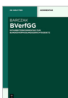
Barczak (Hrsg.) BVerfGG