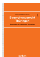
Jäde/Dirnberger Bauordnungsrecht Thüringen