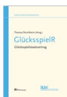
Dünchheim (Hrsg.) GlücksspielR