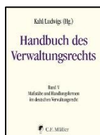
Kahl/Ludwigs (Hrsg.) Handbuch des Verwaltungsrechts

Band I: Grundstrukturen des deutschen Verwaltungsrechts Band II: Grundstrukturen des europäischen und internationalen Verwaltungsrechts Band III: Verwaltung und Verfassungsrecht Band IV: Status des Einzelnen und Verfahren Band V: Maßstäbe und Handlungsformen im deutschen Verwaltungsrecht Band VI: Verwaltungsrecht und Privatrecht Band VII: Organisation und öffentliche Sachen