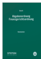
Gosch (Hrsg.) AO/FGO