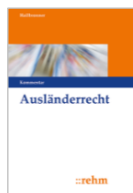
Hailbronner (Hrsg.) Ausländerrecht