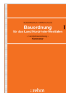
Boeddinghaus/Hahn Bauordnung für das Land NRW