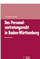
Leuze/Wörz/Bieler Das Personal- vertretungsrecht in BW