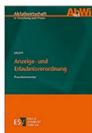
Kropp Anzeig- und Erlaubnisverordnung