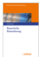
Molodovsky/Famer Bayerische Bauordnung