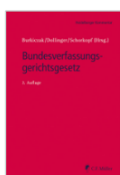
Burkiczak/Dollinger Bundesverfassungs- gerichtsgesetz