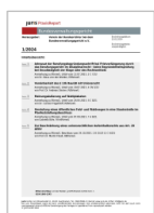
Juris PR BVerwG