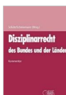
Schütz/Schmiemann Disziplinarrecht des Bundes und der Länder