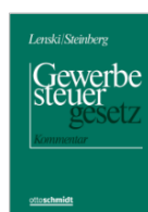
Lenski/Steinberg Gewerbesteuer- gesetz