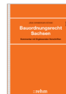
Jäde/Dirnberger Bauordnungsrecht Sachsen