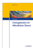
Meyer/Fricke (Begr.) Umzugskosten im öffentlichen Dienst