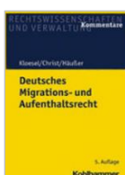
Kloesel/Christ Deutsches Migrations- und Aufenthaltsrecht