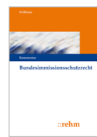
Feldhaus (Hrsg.) Bundesimmisions- schutzrecht