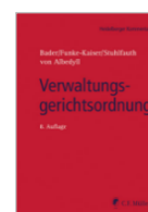
Bader/Funke-Kaiser Verwaltungs- gerichtsordnung