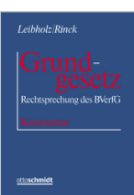
Leibholz/Rinck (Begr.) Grund- gesetz