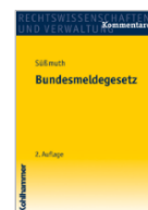
Süßmuth Bundes- meldegesetz