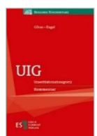
Götze/Engel (Hrsg.) UIG