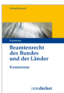
Schütz/Maiwald Beamtenecht des Bundes u. der Länder