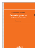
Schwegmann/Summer Besoldungsrecht des Bundes u. der Länder