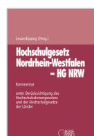
Leuze/Epping (Hrsg.) Hochschulgesetz NRW