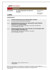
juris PraxisReport Strafrecht