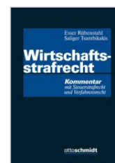
Esser/Rübenstahl/Saliger/ Tsambikakis (Hrsg.) Wirtschaftsstrafrecht