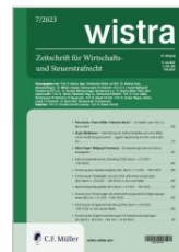
Z. für Wirtschafts- und Steuerstrafrecht (wistra)