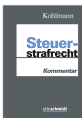
Kohlmann (Begr.) Steuerstrafrecht