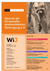
Journal der Wirtschaftsstrafrechtlichen Vereinigung e.V. (WiJ)