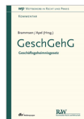
Brammsen/Apel (Hrsg.) GeschGehG