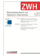
Z. für Wirtschaftsstrafrecht und Haftung im Unternehmen (ZWH)