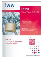
Praxis Steuerstrafrecht (PStR)