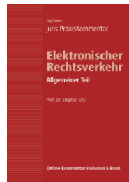
Ory/Weth (Hrsg.) juris PraxisKommentar Elektronischer Rechtsverkehr