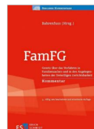
Bahrenfuss (Hrsg.) FamFG