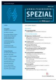
Anwaltsgebühren Spezial mit RVG report (AGS)