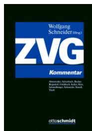
Schneider (Hrsg.) ZVG