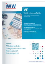
Vollstreckung effektiv (VE)