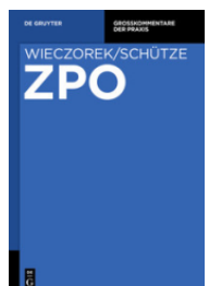
WIECZOREK/SCHÜTZE ZPO Gesamtausgabe