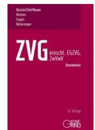
Depré (Hrsg.) ZVG