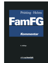
Prütting/Helms (Hrsg.) FamFG