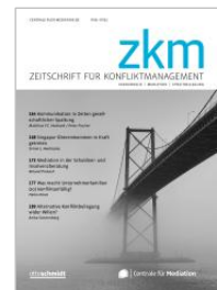
Zeitschrift für Konflikt- management (ZKM)