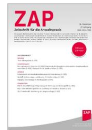
Zeitschrift für die Anwaltspraxis (ZAP)