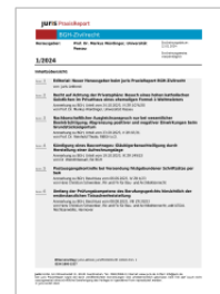
juris PraxisReport BGH-Zivilrecht