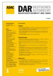
Deutsches Autorecht (DAR)