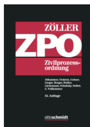
Zöllner (Begr.) ZPO