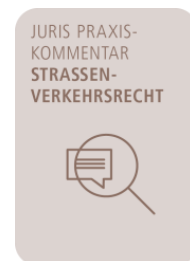
Freymann/Wellner (Hrsg.) juris PraxisKommentar Straßenverkehrsrecht