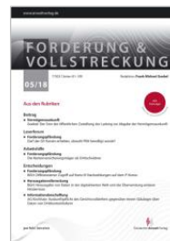
Forderung und Vollstreckung (FoVo)