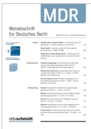
Monatsschrift für Deutsches Recht (MDR)